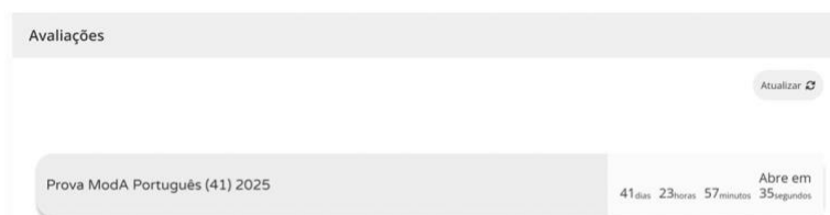
Figura 2 – Acesso à prova a realizar

6.8. Ao clicar em “Iniciar sessão” aparece o seguinte ecrã (exemplo para a prova ModA de Português - 41):